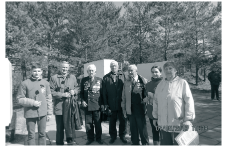
На фото делегация Гимназии №42 с ветеранами на мемориале

Нам, ученикам 6Б и 6Д классов, оказали честь принять участие в старте Вахты памяти этого года. Открытие было на митинге, который состоялся на Булыгинско-Кировском кладбище у Мемориала. В митинге приняли участие ученики 5А, 48, 24, 42 и других школ. Учащиеся 54 школы много лет шефствуют над памятником, поэтому именно им было доверено открыть это торжественное мероприятие. И они действительно смогли тронуть всех присутствующих выразительным исполнением стихотворений,