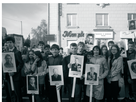
На фото ученики гимназии - участники акции «Бессмертный полк»