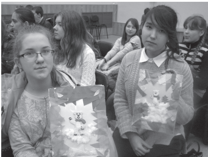
Олимпиада покорила всех! Вот и наши ученицы своими руками создали талисманы Олимпиады в Сочи

Ярким событием прошлого учебного года стала «Эстафета олимпийского огня». Мы все прикоснулись к чему-то ценному и по-настоящему дорогому, возможно, именно участие в этой акции помогло нам всем ощутить себя единым целым, ведь в чаше олимпийского огня загорелась и частичка наших сердец.