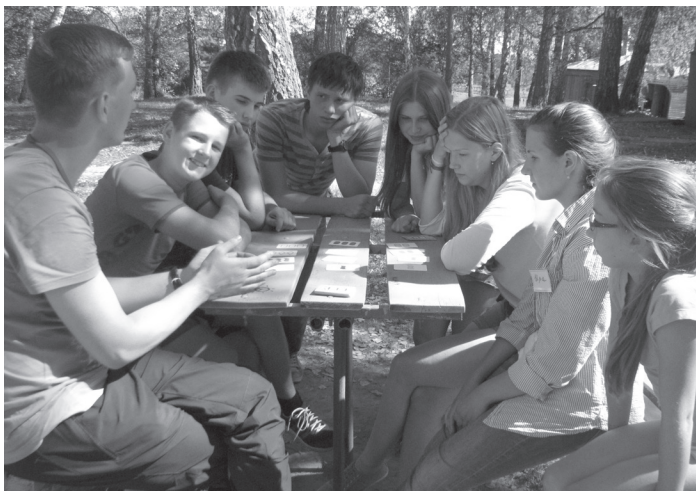
Настольные игры на свежем воздухе

С 20 по 27 августа все ученики принимали участие в физико-математическом марафоне, который заключался в решении и сдаче вожа-