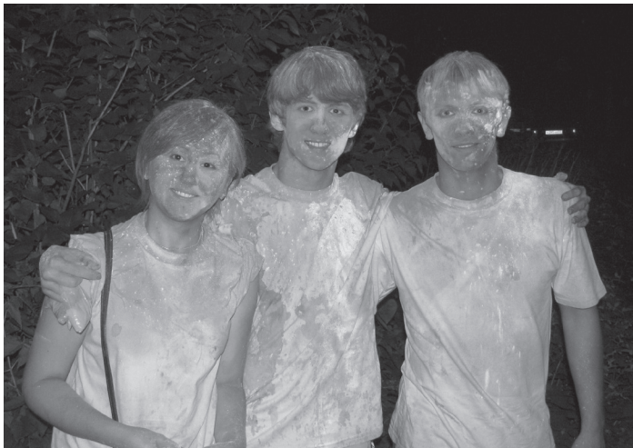
Вот, что получилось после долгого окрашивания

Как только мы зашли на территорию парка, нас сразу заметили веселые девушки и со словами: «Вы