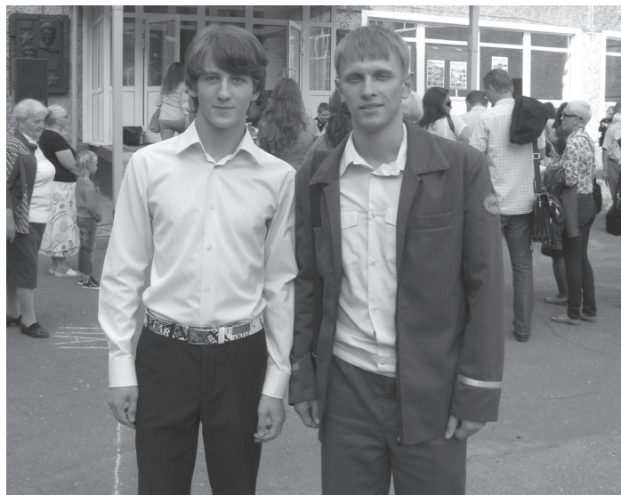
1 сентября 2014

Если вы поедете на общественном транспорте, то наверняка увидите таких же школьников, встретившихся со своими знакомыми и рассказывающих истории о лете и о школе. Они находятся в каком-то предвкушении всего нового, ждут, что этот учебный год будет хоть капельку лучше и интереснее прошлого. А есть и такие люди, которые в этом году заканчивают свое обучение.