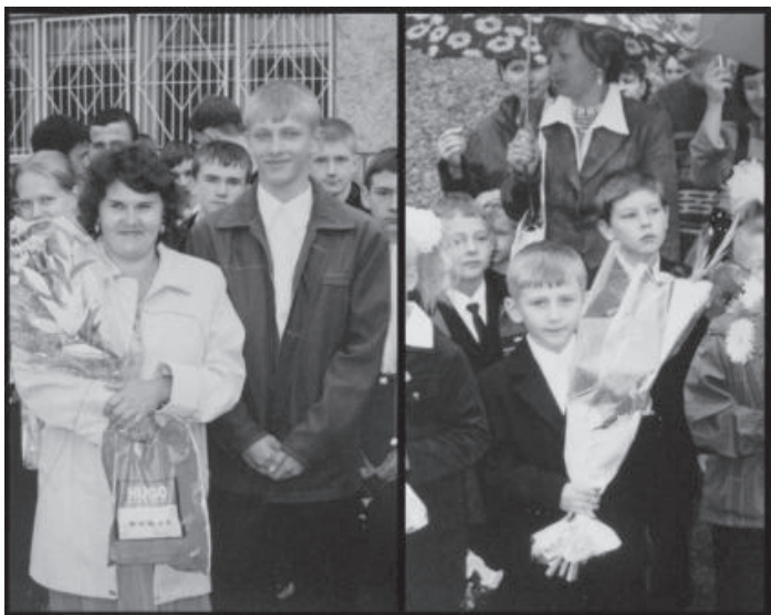
1 сентября 2004