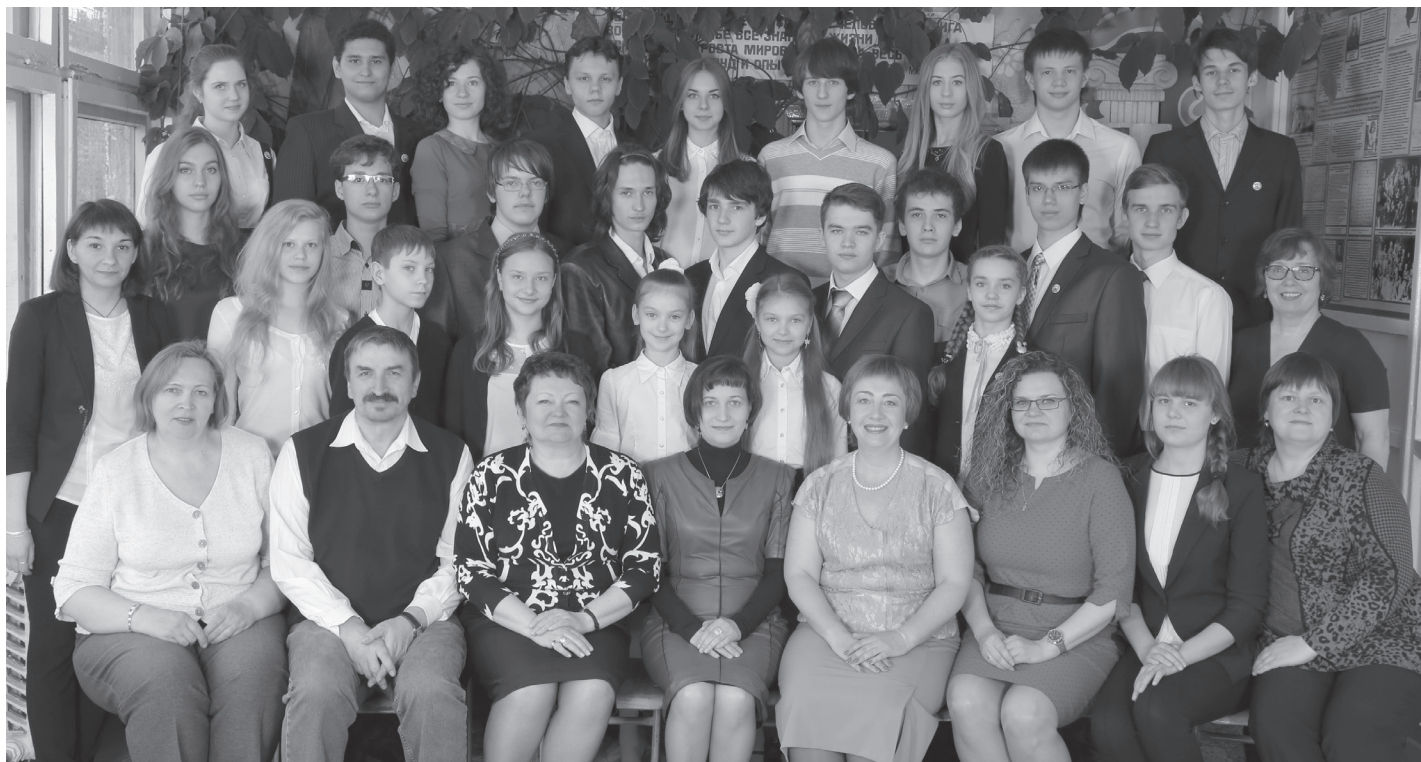
Победители и призеры регионального этапа Всероссийской олимпиады школьников с педагогами-наставниками

Школьные олимпиады – шанс для каждого, и участие в них – дело добровольное. Итак, в