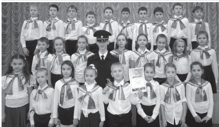
Участники конкурса песни и строя