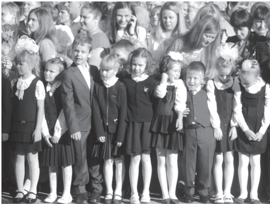
Линейка в честь Дня знаний

Яркое солнце, синее безоблачное небо и сочная зелень за окном — отличный летний день! Но, если верить григорианскому календарю, сегодня наступила осень! А значит, пришло время встретиться вновь. Торжественные линейки, посвященные Дню знаний, прошли в этом году для 1550 гимназистов, их родителей и педагогов нашей гимназии.