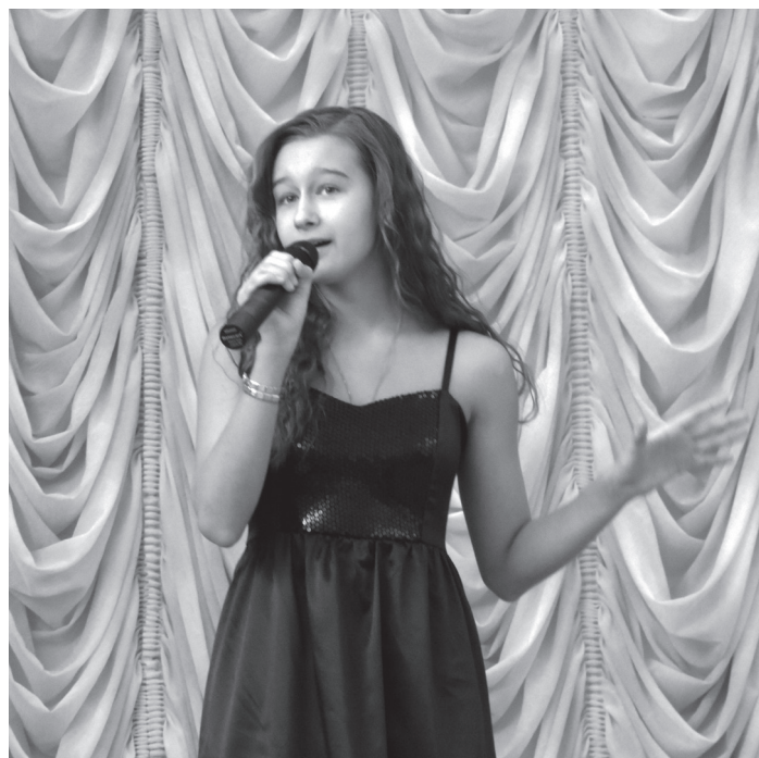
Главная цель участников «Фестиваля иностранной песни» - не «золотая» статуэтка, а душевный отдых