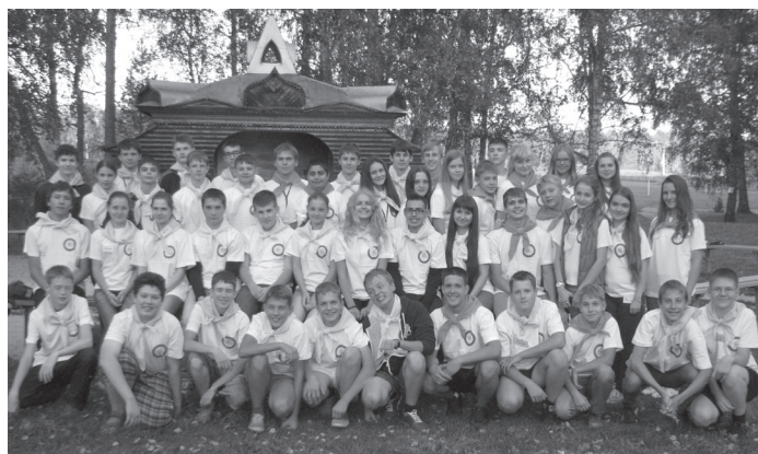
Участники летних физико-математических сборов

дят интенсивное обучение по программе олимпиадной физики и математики. Наряду с педагогами МБОУ «Гимназия №42» в лагере работают преподаватели математического факультета АлтГУ, преподаватели факультета специальных технологий АлтГТУ. Помимо лекционных занятий проводятся практикумы по решению задач, лабораторные работы, олимпиады, предметные