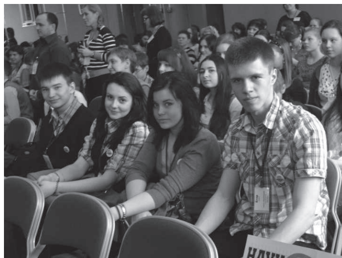
Редакция газеты «НаукОград42» на Всероссийском конкурсе школьной прессы

тельный человек, если он им является, так как в этой профессии очень много подобию, рерайтеров, скучных обзорщиков, модных обозревателей.